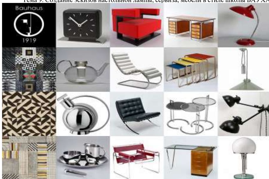
Тема 10. Любая копия работа автора или фото коллаж в стиле школы БАУХАУЗ. Формат А3, материалы: цветные карандаши, краски или фломастеры.